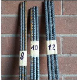
ACCIAI: prova di trazione e piegamento (3 barre da almeno 120